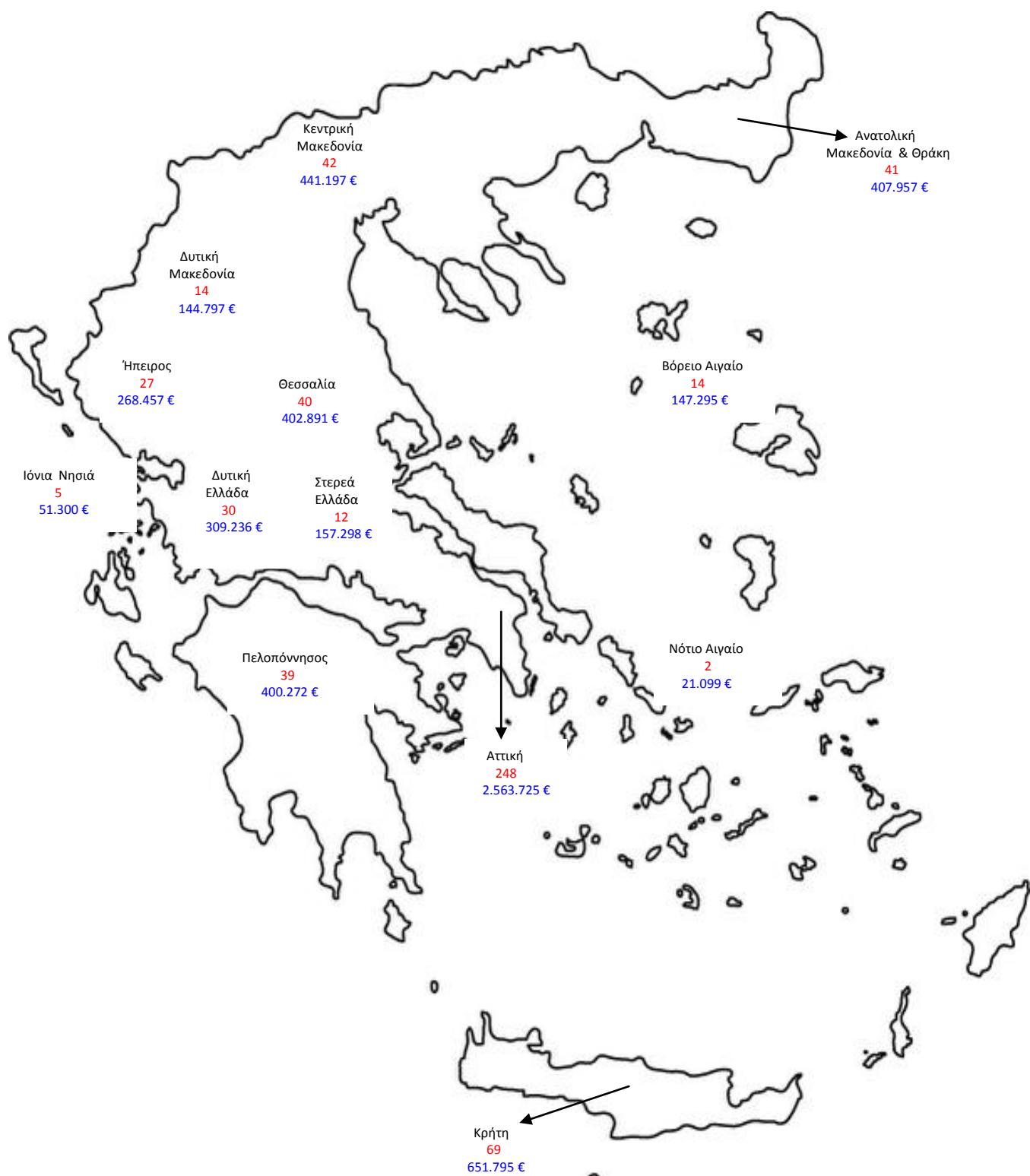
ΧΑΡΤΗΣ : ΑΔΗΛΩΤΟΙ ΕΡΓΑΖΟΜΕΝΟΙ ΚΑΙ ΠΟΣΑ ΕΠΙΒΛΗΘΕΝΤΩΝ ΠΡΟΣΤΙΜΩΝ ΑΝΑ ΠΕΡΙΦΕΡΕΙΑ