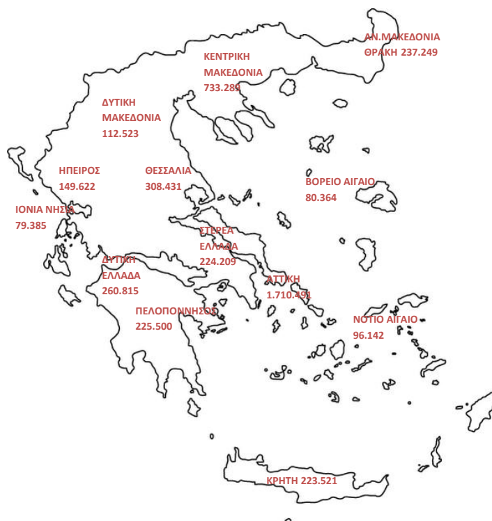
Χάρτης 1: Καταβολή Συντάξεων ανά Περιφέρεια

Στον Πίνακα 9 αποτυπώνονται τα ποσά σύνταξης που αντιστοιχούν σε κάθε Περιφέρεια σε σχέση με το αντίστοιχο ΑΕΠ για το έτος 2010 (προσωρινά στοιχεία ΕΛΣΤΑΤ). Σύμφωνα με τα δεδομένα του Πίνακα 9, στην Περιφέρεια Ηπείρου παρατηρείται η μεγαλύτερη τιμή (17,5%) του λόγου ποσού σύνταξης προς ΑΕΠ και ακολουθεί η Περιφέρεια Θεσσαλίας με τιμή 17,1%. Στην τελευταία θέση βρίσκεται η Περιφέρεια Νοτίου Αιγαίου με τιμή 7,8%.