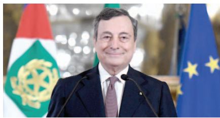
Μάριο Ντράγκι Πρωθυπουργός