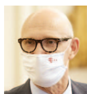
Tim Hottges, CEO Deutsche Telekom

Μία μέρα μετά την ολοκλήρωση της δημοπρασίας για τις συχνότητες της νέας γενιάς κινητής τηλεφωνίας, ο ΟΤΕ ήταν έτοιμος και ανακοίνωσε χθες την εμπορική διάθεση δικτύου Cosmote 5G σε Αθήνα, Θεσσαλονίκη και άλλες πόλεις της Ελλάδας με