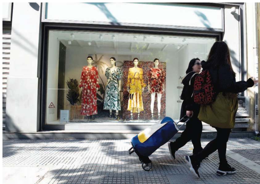
Από τη Δευτέρα 11 Μαΐου επιχειρήσεις ενδυμάτων, υποδημάτων και δερμάτινων ειδών, εξοπλισμού ήχου και εικόνας, ηλεκτρικών οικιακών συσκευών, επίπλων, φωτιστικών και άλλων ειδών οικιακής χρήσης, παιχνιδιών, καλλυντικών, ρολογιών και κοσμημάτων κ.ά επανεκκινούν από τα φυσικά τους καταστήματα. σελ. 7

σβασης στο πιστωτικό όριο θα είναι ότι τα κράτη-μέλη που ζητούν υποστήριξη πρέπει να δεσμευτούν ότι η πιστωτική γραμμή θα διατεθεί για τη στήριξη της εγχώριας χρηματοδότησης άμεσων και έμμεσων δαπανών υγειονομικής περίθαλψης, θεραπείας και πρόληψης λόγω της πανδημίας. Η μέση διάρκεια των δανείων θα είναι 10 έτη, ενώ η παρακολούθηση θα γίνεται με ενιαίο τρόπο. Σύμφωνα με τον επικεφαλής του ΕΜΣ, Κλάους Ρέγκλιγκ, το επιτόκιο θα κινείται οριακά πάνω από το μηδέν. σελ. 5