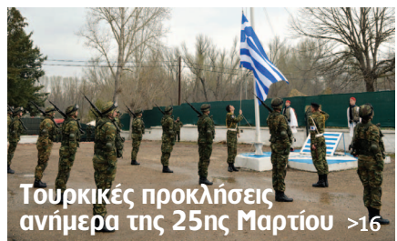
Τουρκικές προκλήσεις ανήμερα της 25ης Μαρτίου >16