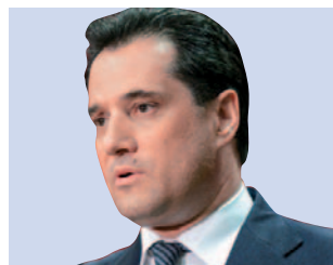
Άδωνις Γεωργιάδης υπ. Ανάπτυξης και Επενδύσεων σελ. 7

Με στόχο να ξεκινήσουν άμεσα ορισμένες πρώτες κατεδαφίσεις στο παλιό αεροδρόμιο στο Ελληνικό, ώστε να σηματοδοτήσουν την έναρξη της μεγάλης ανάπτυξης των 8 δισ. ευρώ, το υπουργείο Ανάπτυξης κατέθεσε στη Βουλή, ως μέρος του νομοσχεδίου για την «Ίδρυση, λειτουργία και εκμετάλλευση επί υδάτινων επιφανειών», τις σχετικές ρυθμίσεις τις οποίες είχε παρουσιάσει η «Ν» με ρεπορτάζ της στις 17.1.2020. σελ. 7